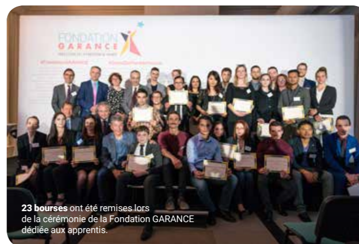
23 bourses ont été remises lors de la cérémonie de la Fondation GARANCE dédiée aux apprentis.