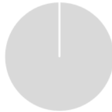
2. Alignement des investissements sur la taxinomie, hors obligations souveraines *